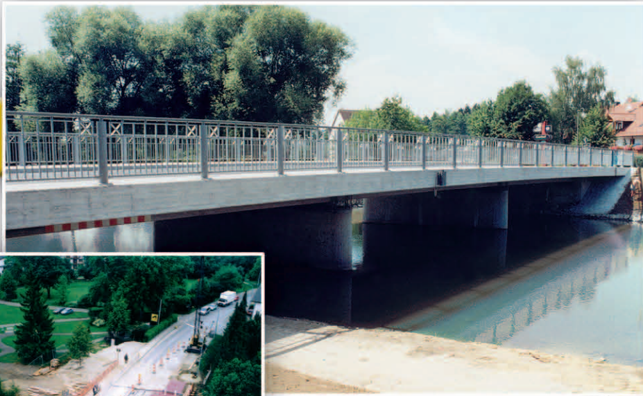
Abensbrücke Bad Gögging